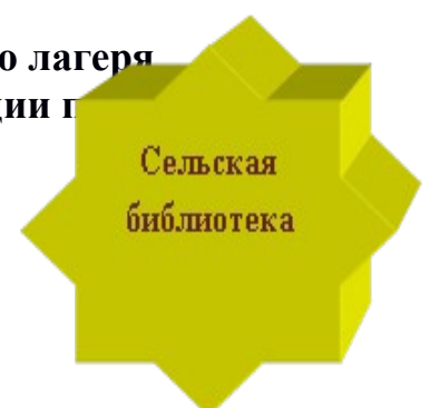
Схема взаимодействия пришкольного лагеря «Время приключений» с социумом в реализации п